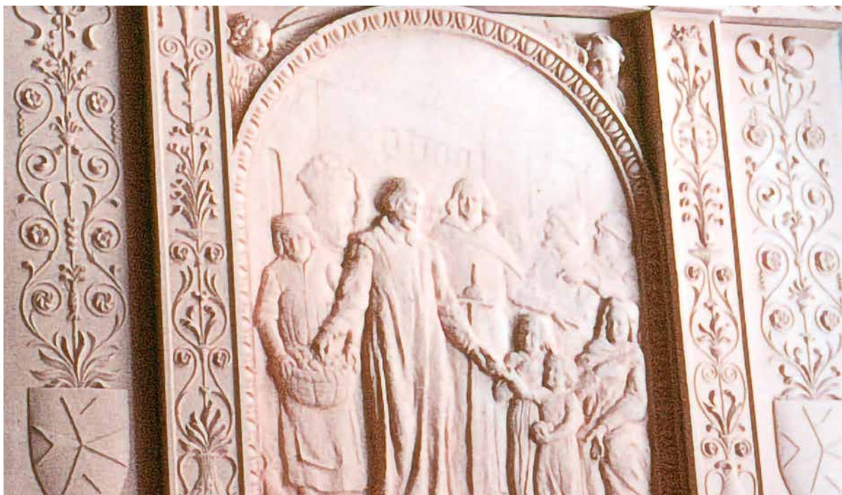
Détails du retable avant émaillage